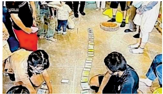
【国際芸術祭レガシー事業】

さらに、市民の多様化する文化芸術活動を支えるため、文化芸術創造拠点の整備を進める必要があります。