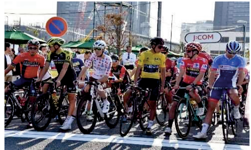
【ツール・ド・フランスさいたまクリテリウム】

さらに、「(一社)さいたまスポーツコミッション」の活動を支援することにより、地域のスポーツ機会を創出し、市の魅力を発信するとともに、地域の活力を生み出していく必要があります。