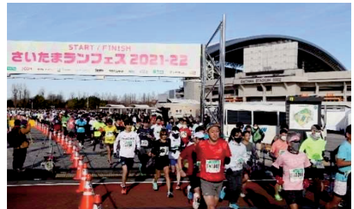
【さいたまランフェス2021-22】